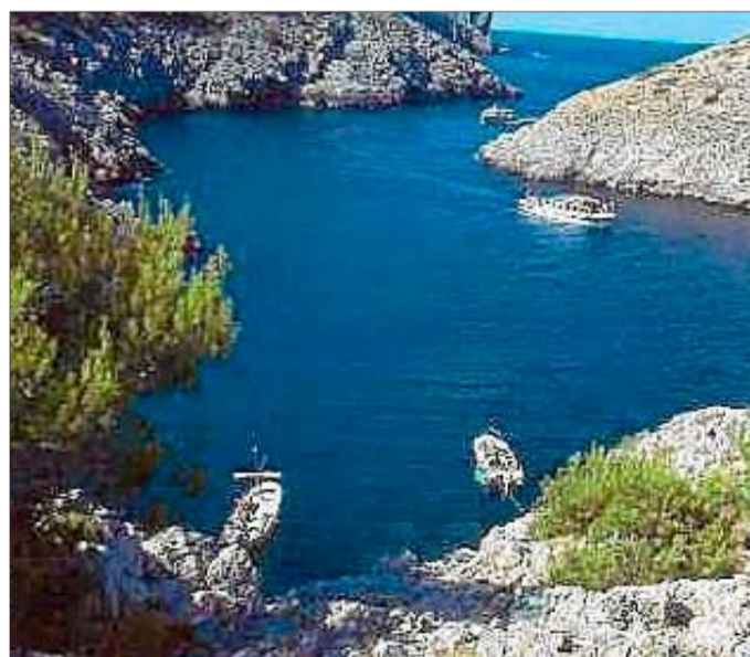
La bellíssima Cala Pedrosa es troba a la Costa Brava.