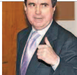
MONTERRAT T. DIEZ/EFE